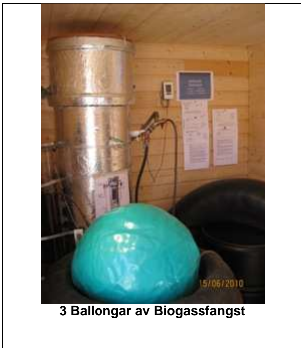
3 Ballongar av Biogassfangst