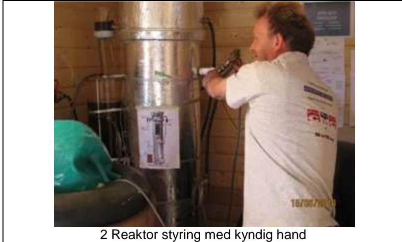
2 Reaktor styring med kyndig hand