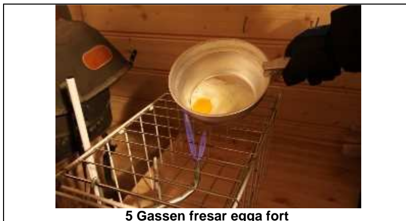
5 Gassen fresar egga fort

Målet i fyrste omgang er å prøve ut prinsipp og anleggsløysing på eit anlegg for ein eller to gardar. Det er førebels tenkt på å tilpasse eksisterande tank