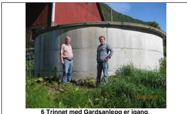
6 Trinnet med Gardsanlegg er igang.

Målet i fyrste omgang er å prøve ut prinsipp og anleggsløysing på eit anlegg for ein eller to gardar. Det er førebels tenkt på å tilpasse eksisterande tank