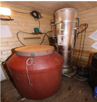
Minianlegget for biogass i Fjærland