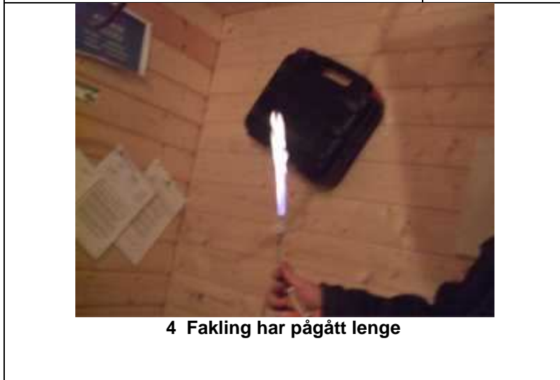
4 Fakling har pågått lenge