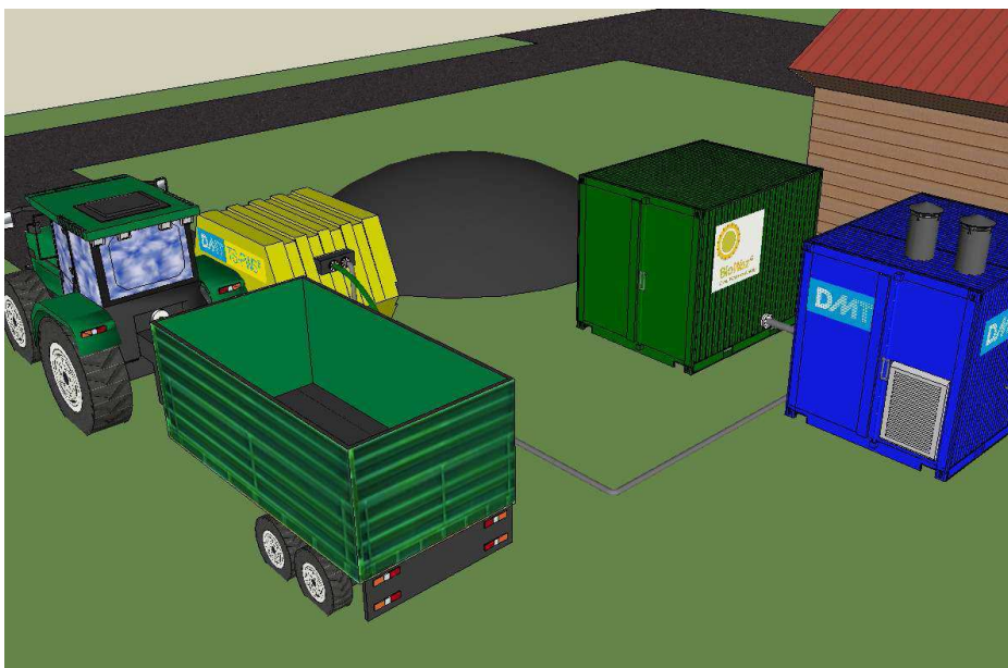
Bildet: DMTs Minicarbo2rex® - small scale biogas upgrading plant Se produktinformasjon på http://www.biowaz.com/Products.aspx

Distribusjon av gass utenfor anlegget, påkobling til oppgraderingsanlegg, eller konvertering av eksisterende utstyr er ikke inkludert i tilbudet.