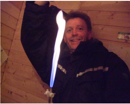
Fakling frå metan til CO2